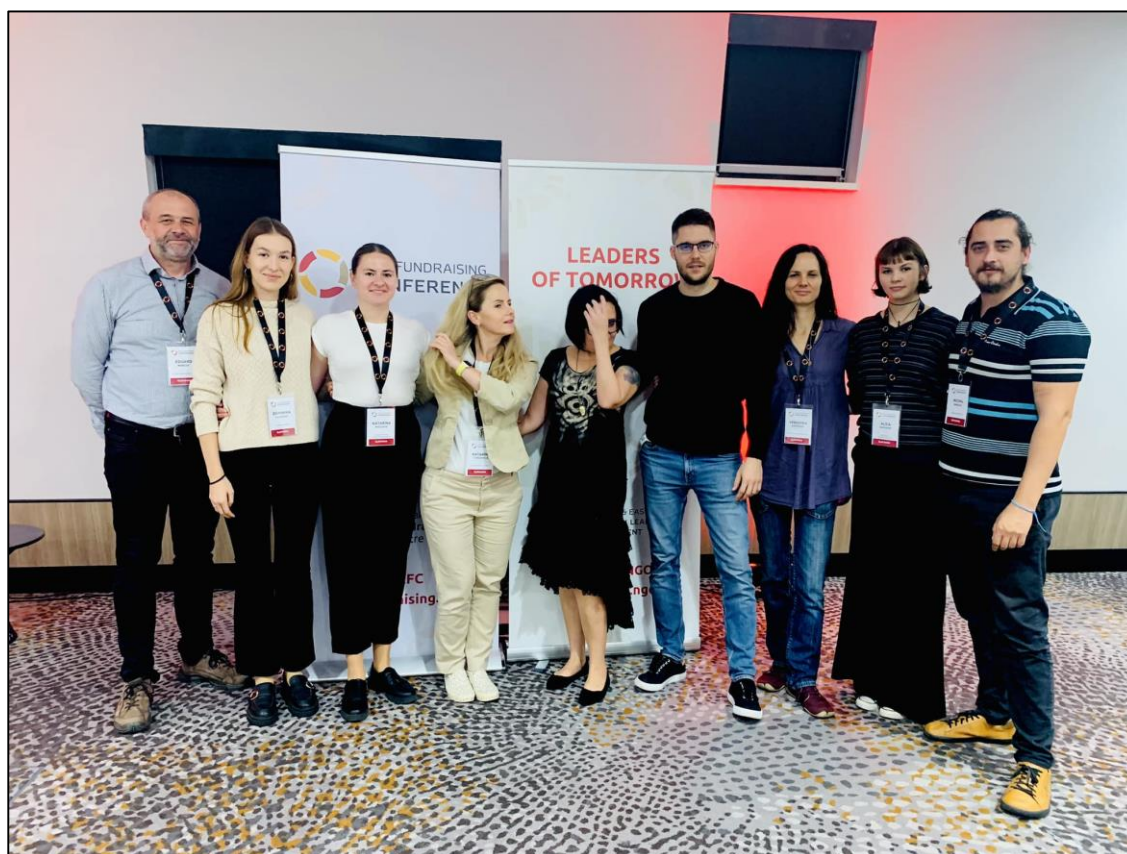
Organizačný team CEE Fundraising Conference 2023